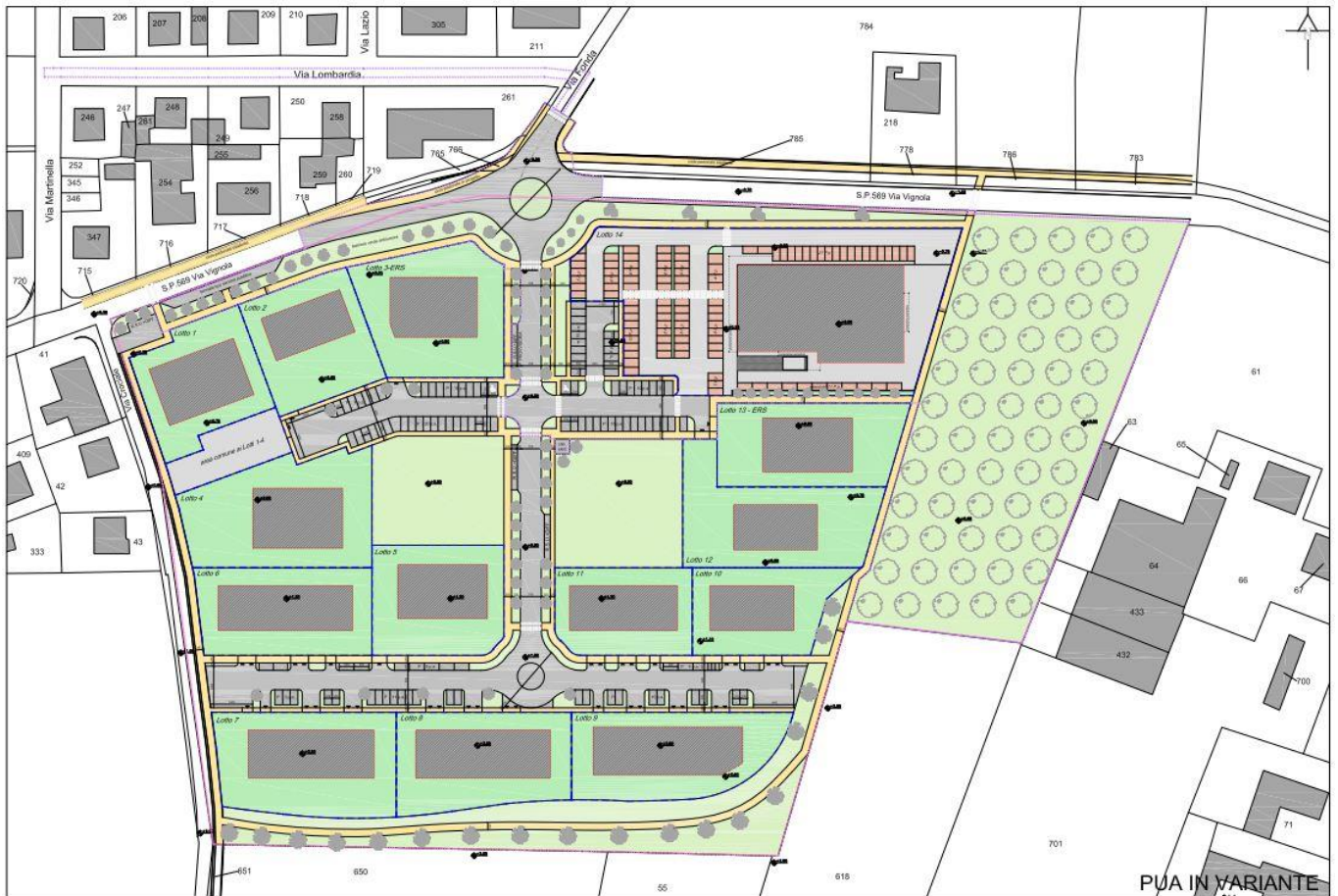
Fig. 2 – Planimetria PUA in Variante (scala grafica).

Tenuto conto della limitata variante, si confermano le risultanze desunte dalle indagini geognostiche e sismiche eseguite e riportate nella Relazione Geologica-Sismica redatta dallo scrivente nel luglio 2012, rimandando, in accordo con il tecnico Progettista, alla fase progettuale dei singoli lotti gli approfondimenti geognostici e le verifiche geotecniche come da NTC08. Sulla base di quanto verificato, si conferma quindi la fattibilità degli interventi previsti e la compatibilità della variante con le caratteristiche geologiche e sismiche dell'area.